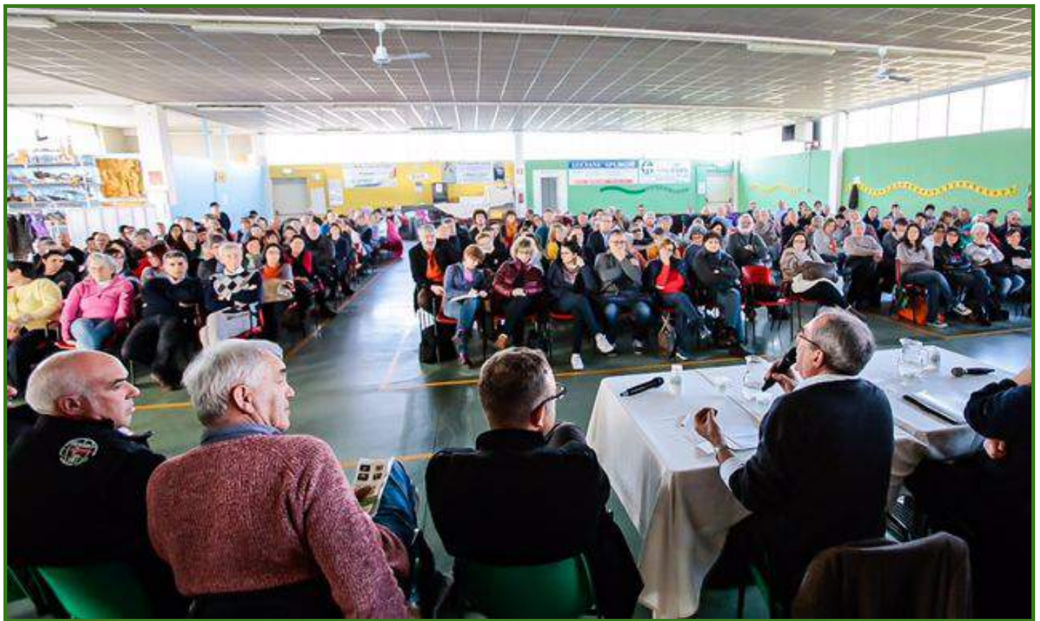
i produttori, i gasisti di oggi...