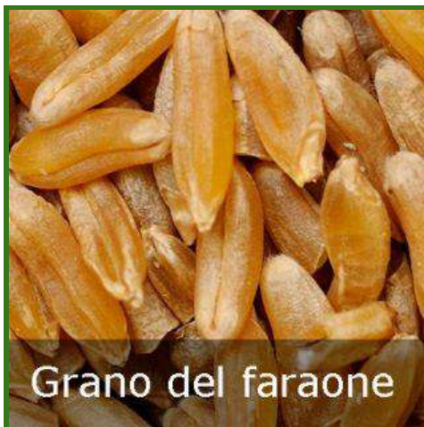
Grano del faraone

La varietà di questo grano è simile a quella di altri grani antichi provenienti dall'Egitto ma anche dall'Italia meridionale (saragolla); caratteristiche comuni sono l'alto livello di proteine e vitamine e una minor presenza di glutine.